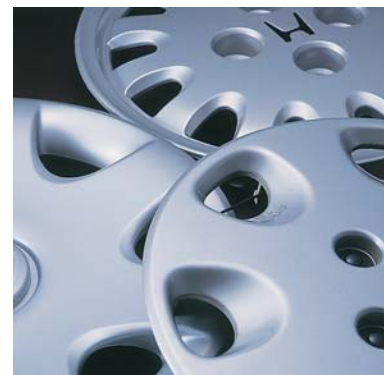
タイヤのホイール