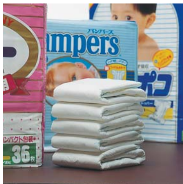
おむつカバー等の接着テープ