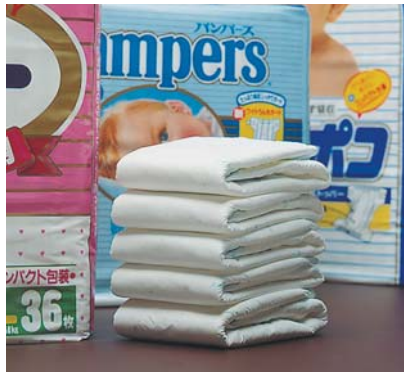
おむつカバー等の接着テープ