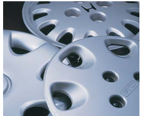
タイヤのホイール