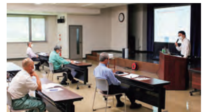
役員トレーニング