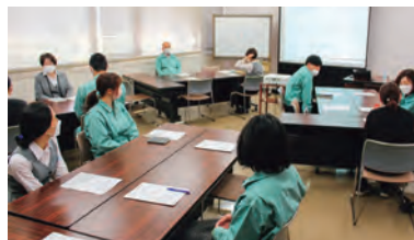
ハラスメント研修

また、取締役を対象としたコンプライアンス研修でもハラスメント研修を取り入れることで、社員全員がハラスメント防止への意識を高め、安心して働ける職場づくりをめざします。